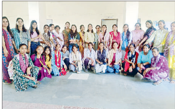
रेवाड़ी। कार्यक्रम में शिक्षिकाओं के साथ छात्राएं।