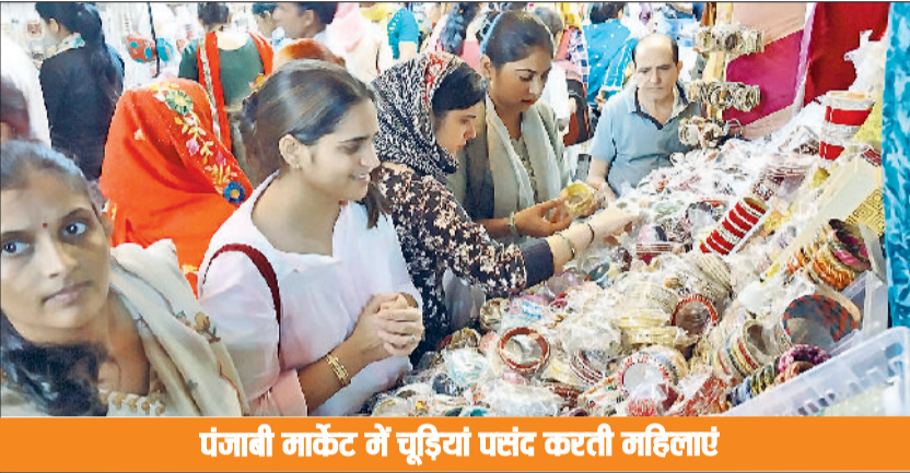
पंजाबी मार्केट में चूड़ियां पसंद करती महिलाएं