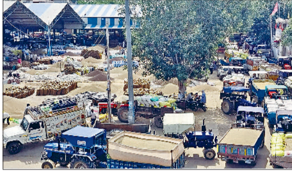
रेवाड़ी। अनाजमंडी के फड पर लगी बाजरे की ढेरियां व लगा जाम व अनाजमंडी के गेट पर गेटपास कटवाते किसान।