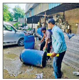
रेवाड़ी। लावां मिलने पर इम का पानी खाली करते स्वास्थ्यकर्मी, पानी की टंकी में दवाई डालते हुए स्वास्थ्यकर्मी।

चुके है। इसके अलावा पिछले दिनों मलेरिया के भी 14 केस मिल चुके है। गत वर्ष अक्टूबर माह में 173 व नवंबर माह में 154