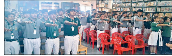
रेवाड़ी। कार्यक्रम में नशे से दूर रहने की शपथ लेते विद्यार्थी।