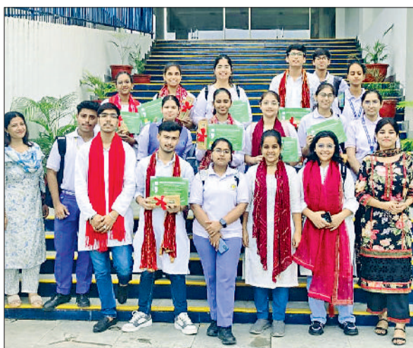
रेवाड़ी। प्रतियोगिता में भाग लेने वाली टीम शिक्षकों के साथ।

जैन पब्लिक स्कूल की टीम ने गुरुग्राम में मानसिक स्वास्थ्य पर आयोजित प्रतियोगिताओं में अपनी प्रतिभा का लोहा मनवाया है। टीम ने नुककड नाटक एवं वाद विवाद स्पर्धा में भाग लिया। स्कूल की टीम ने नुककड नाटक प्रतियोगिता में दूसरा स्थान प्राप्त किया।