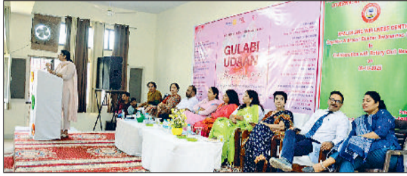
रेवाड़ी। कार्यक्रम में मौजूद अतिथि व कॉलेज स्टाफ।

▶▶ कार्यक्रम में 350 से अधिक छात्राओं ने भाग लिया सभी अतिथियों का स्वागत पौधा व पटक भेंट किया