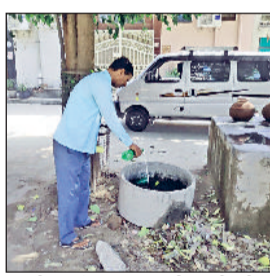
डेंगू पॉजिटिव मरीज मिलने से आंकड़ा 400 पार पहुंच गया था।

चुके है। इसके अलावा पिछले दिनों मलेरिया के भी 14 केस मिल चुके है। गत वर्ष अक्टूबर माह में 173 व नवंबर माह में 154